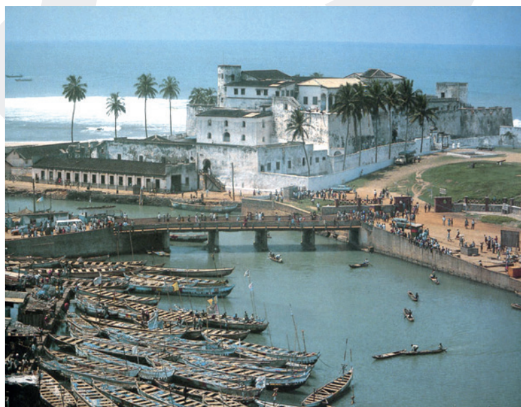
S. Jorge da Mina