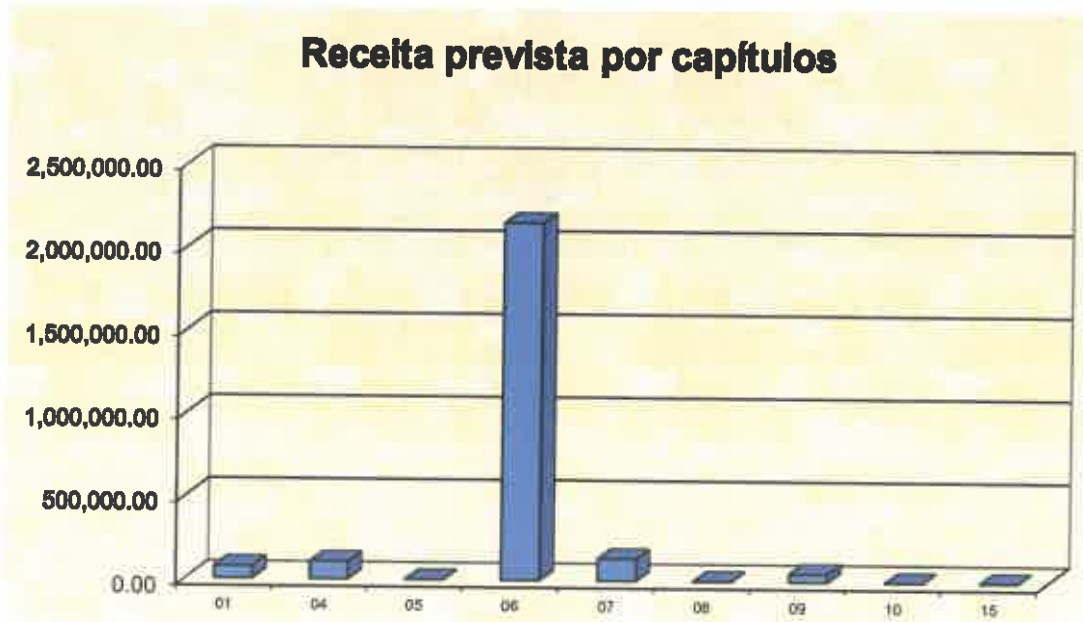
Gráfico n.º 1- receita prevista por capítulos